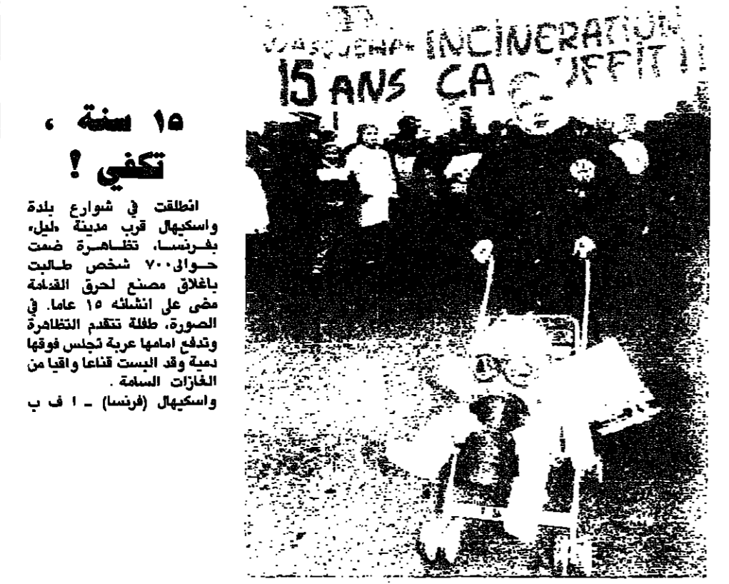
انطلقت في شوارع بلدة واسكيل قرب مدينة طيل، بفرنسا، تظاهرة ضمت حوالي ٧٠٠ شخص طالبت باغلاق مصنع لحرق القنحة مضي على انشائه ١٥ عاماً. في الصورة، طفلة تقدم التظاهرة وتقدم امامها عربة تجلس فوقها نعمة وقد البست قناعاً واقياً من الغازات السامة. (فرنسا)